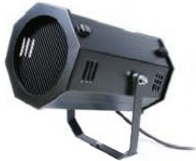
PAR 64 octogonal