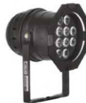
← PAR 64 à LED (12 LEDS : Synthèse de couleur additive RVB + Blanc + Ambre + UV)