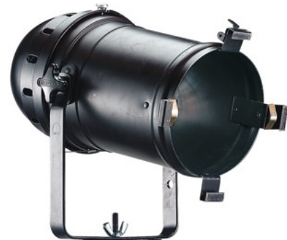
PAR 64 sans porte-filtre

Ci-dessus 4 PAR 64 et au centre, un PAR 36 : les puissances des lampes PAR vont de 5W à 1000W. Celles qui nous intéresseront le plus couramment sont la CP 60, CP 61, CP 62 et CP95 (voir fiche 2-3). Ce sont des projecteurs qui ont reçu le nom de la lampe qu'ils portent. Avec ces projecteurs, légers et vite réglés, il n'y a pas de réglage possible du faisceau lui-même qui est déterminé seulement par la lampe. Il y a tout de même la possibilité d'orienter la lampe, ce qui permet de faire varier sur 360° le sens de l'ovale du faisceau (dite en forme de « banane »).