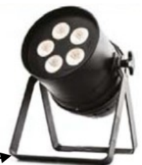
Double lyre pratique pour implanter le projecteur au sol