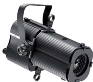
Mini-découpe (idéale pour les petits espaces)