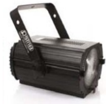
Un PC à LED

Les PC ou Fresnel à LED sont de plus en plus performants, peuvent être pilotables sous DMX 512 sur un ou deux canaux (durée de vie pouvant aller jusqu'à 40000 heures ...)