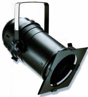
PAR 64 LONG