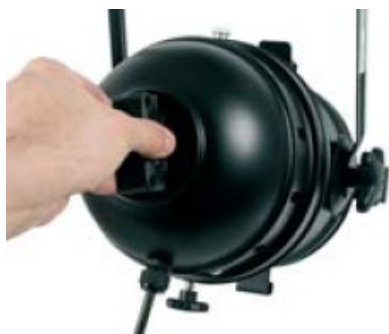
Vue arrière Réglage : orientation de la « banane »