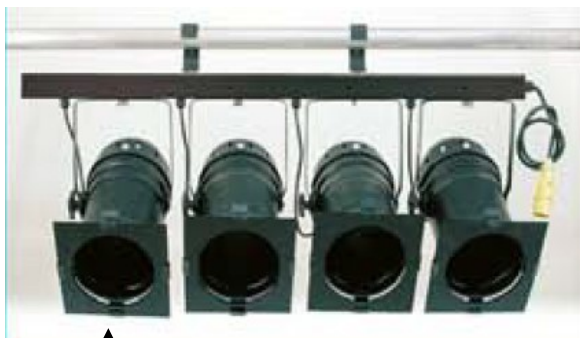
↑ 4 PAR 64 montés en série sur rampe Kit de 2 rampes (alimentation : P17 110 V jaune pour chaque rampe)

Ci-dessus 4 PAR 64 et au centre, un PAR 36 : les puissances des lampes PAR vont de 5W à 1000W. Celles qui nous intéresseront le plus couramment sont la CP 60, CP 61, CP 62 et CP95 (voir fiche 2-3). Ce sont des projecteurs qui ont reçu le nom de la lampe qu'ils portent. Avec ces projecteurs, légers et vite réglés, il n'y a pas de réglage possible du faisceau lui-même qui est déterminé seulement par la lampe. Il y a tout de même la possibilité d'orienter la lampe, ce qui permet de faire varier sur 360° le sens de l'ovale du faisceau (dite en forme de « banane »).