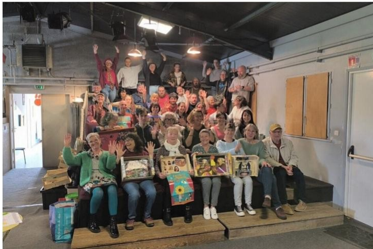
Les bénévoles préparent la 41 e édition du Festival de théâtre de Josselin (Morbihan).

Le théâtre amateur prend ses marques à Josselin (Morbihan) pour la 41 e édition du Festival de théâtre du 28 au 31 mai 2025.