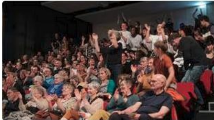
Une vraie communion avec le public du théâtre de La Rochette lors de la 40 e édition du Festival de théâtre en amateur.

Du mercredi 28 au samedi 31 mai, l'Adec (Art dramatique expression culture) 56, donne rendez-vous à Josselin (Morbihan), pour quatre jours de fête du théâtre. À l'affiche, une vingtaine de spectacles de théâtre en amateur du Grand Ouest.