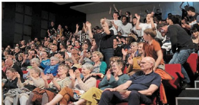
Une vraie communion avec le public du théâtre de La Rochette lors de la 40 e édition du Festival de théâtre en amateur.

Les pièces proposées auront des registres très variés : comédies, farces, tragédies, théâtre engagé appartenant à des répertoires contemporains ou classiques. Se feront aussi des incursions dans d'autres disciplines, comme la musique, le chant, la