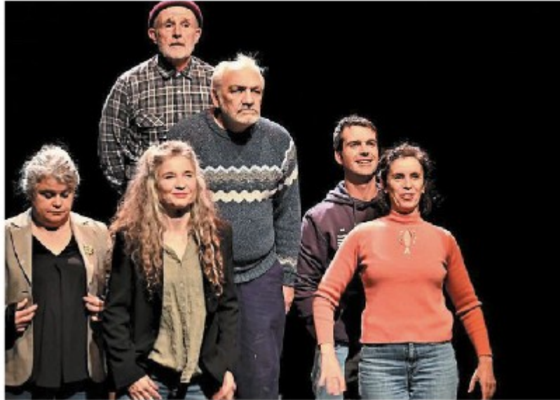
Patatras ! Une création par Les Piqueteros de Brest (Finistère).

C'est la dernière journée du Festival de théâtre amateur de l'Adec 56 et le programme reste riche. Petit aperçu, non exhaustif, afin de donner l'envie de s'y rendre. Au centre culturel de l'Écusson, à 16 h, Patatras ! création par Les Piqueteros de Brest. Cette pièce est gratuite et dure 1 h 30. À 20 h 30, Coupures par le Théâtre de la prise multiple de Nantes.