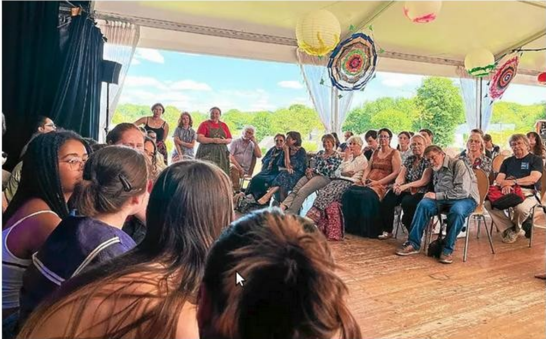
Les jeunes comédiens, dont ceux de l'Uco Arradon, ont partagé un moment d'échange avec le public à la fin des représentations, vendredi 30 mai au centre culturel L'Écusson à Josselin. (Laslo Boulvais-Kowal)

Cinq troupes de jeunes comédiens, dont des étudiants de l'Uco Arradon, sont venues s'illustrer sur scène au Festival de théâtre amateur de Josselin, vendredi 30 mai.