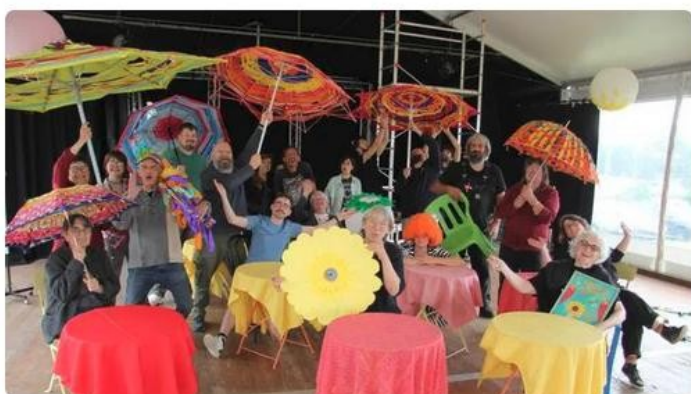
La grande soirée cabaret, du samedi 31 mai 2025, à 22 h 30, va donner vie à une création collective : « La grande revue », un spectacle haut en couleur et en bonne humeur. L'an dernier, plus de 3 500 personnes sont venues au Festival.

Du mercredi 28 au samedi 31 mai 2025, l'Adéc 56 (Art dramatique expression culture 56) donne rendez-vous à Josselin (Morbihan), pour quatre jours de fête du théâtre programmant une vingtaine de spectacles de théâtre en amateur du Grand Ouest.