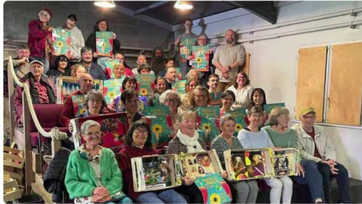
Une partie de bénévoles réunis dans la salle emblématique de l'Adec. Certains sont là depuis le début, il y a 40 ans, d'autres arrivent cette année... Une belle aventure humaine au profit de la culture théâtrale et de Josselin ! | OUEST-FRANCE