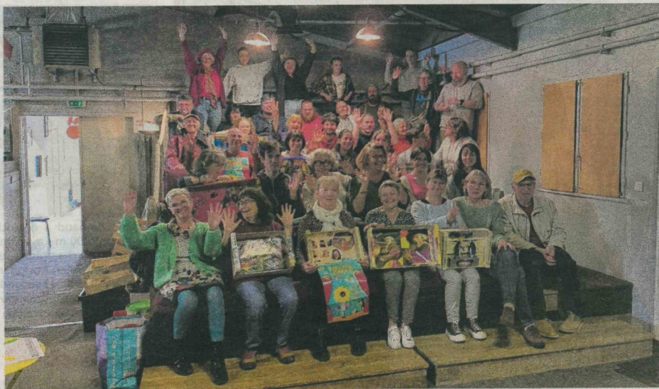
Les bénévoles préparent la 41 e édition du Festival de théâtre de Josselin.

Et cette année encore, ils mettent les petits plats dans les grands : au programme, 19